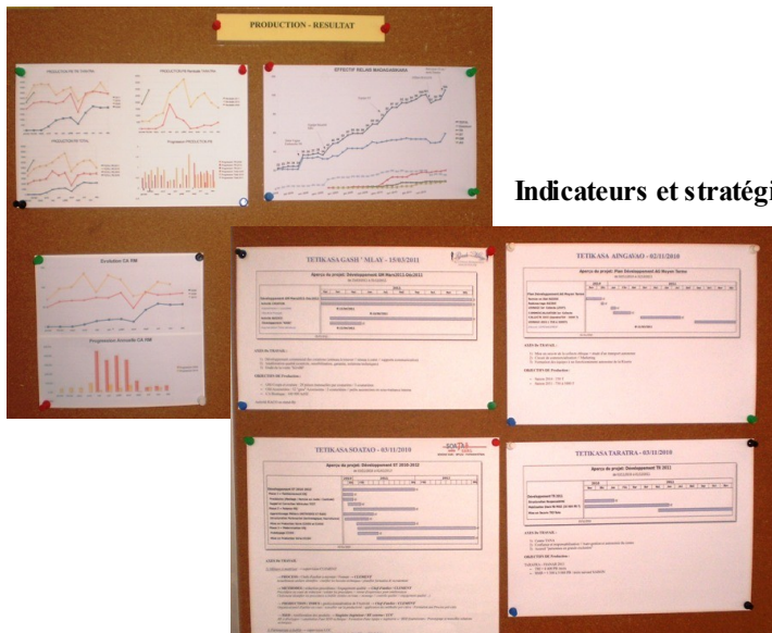
Indicateurs et stratégie

Accessoirement, on a aussi travaillé, et de manière méthodique, jugez-en par la suite !