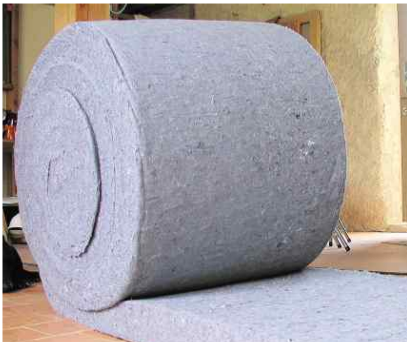
Les bénévoles du Relais collectent environ 60 000 tonnes de vêtements usagés. Les plus abîmés sont effilochés et agglomérés pour en faire un produit isolant : le Métisse .