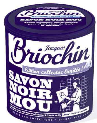
Look année 1970 pour la boîte collector, vendue 6,95 €.

La marque Jacques Briochin a décidé de relancer la commercialisation