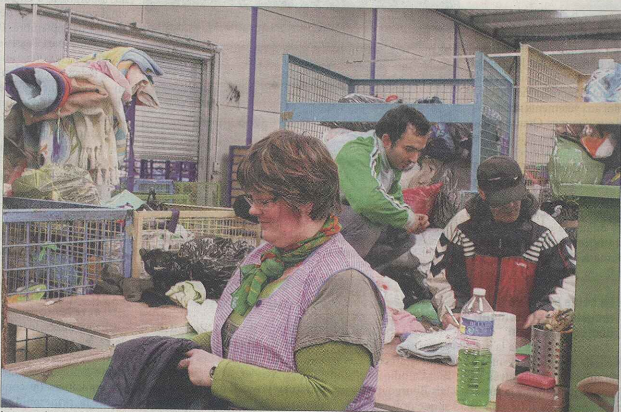
Les « crakers » déchirent les sacs et alimentent les tapis d'acheminement de la chaîne de tri de vêtements.