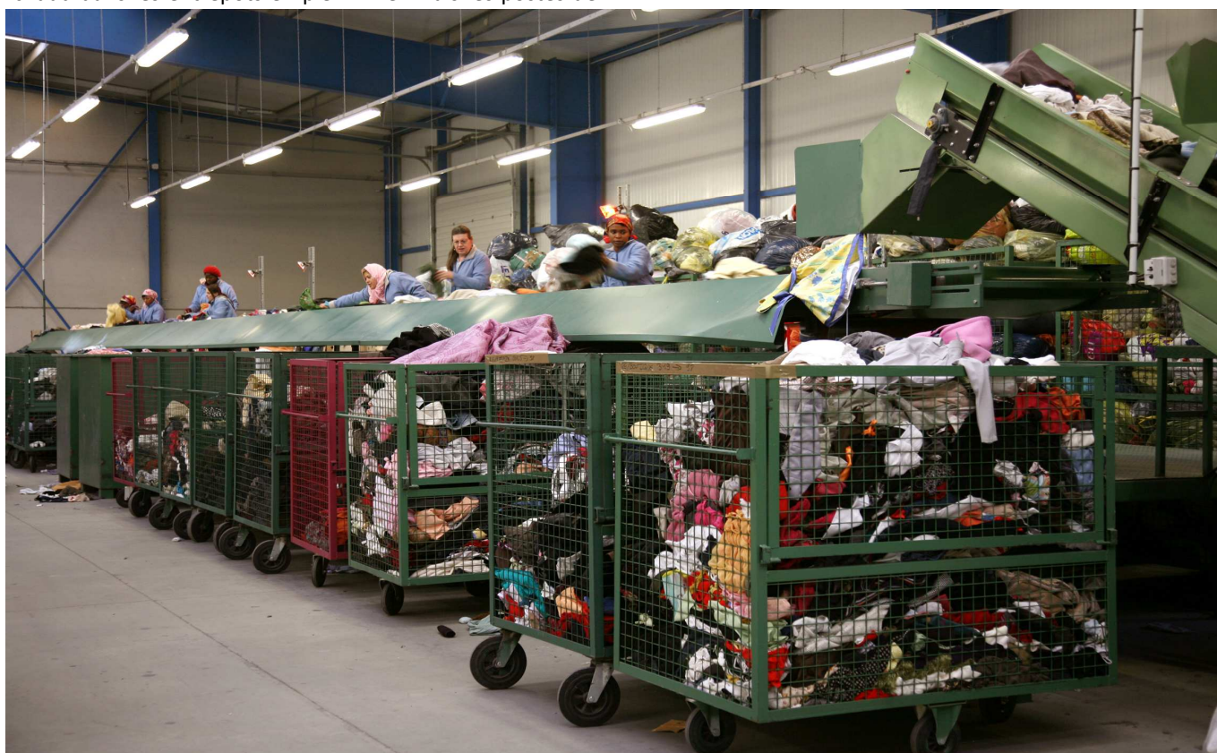
Patrice Normand / TempsMachine

On regarde, ébahi, défiler les pulls, draps, pantalons : un bac pour les jeans, dans un coin le tri des chaussures, ici les T-shirts deviennent des chiffons industriels (c'est du coton) et plus loin le molleton des sweats partira ailleurs. La démesure de cet étalage brut de choses « en trop », dont « on » ne sait que faire -puisque tout vient du don- frappe tous les visiteurs. Et l'importance de leur consacrer un lieu, du temps, une industrie sonne comme une évidence. Ici commence la 2 e (ou 3 e , ou 4 e ...) vie de ce qui nous a habillé, vêtu, réchauffé. Le credo du ré-ré-ré affiché sur une porte le confirme : ici, on récupère, recycle, réinsère. Parce que dans un monde où tout va vite, il faut bien des endroits qui se préoccupent de ce et ceux qui ne suivent plus.